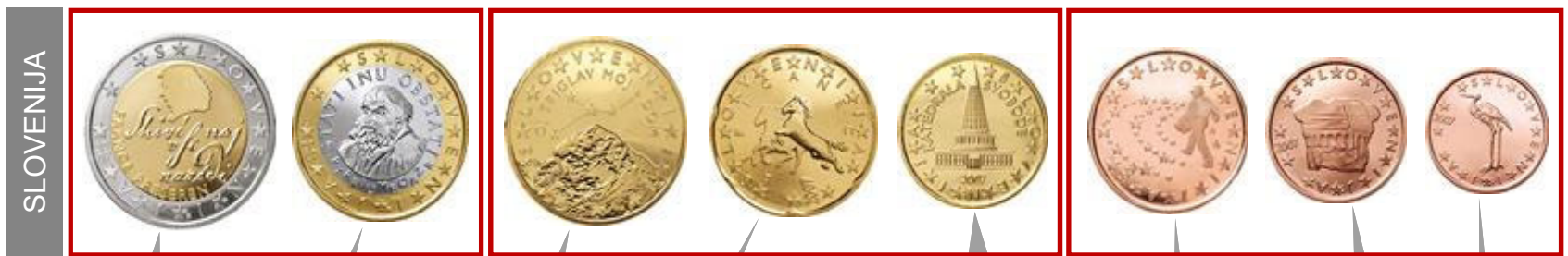
Portret pjesnika France Prešerna